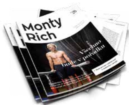
Tištěný magazín MontyRich